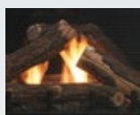
M42LOG4 Bûches de chêne