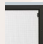
Écran de sécurité