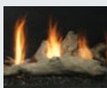
M42LOG3 Bois de grève