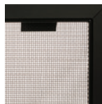
Écran de sécurité