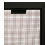
Écran de sécurité