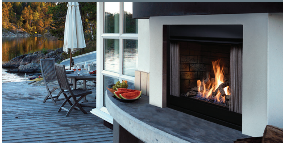
L'appareil illustré est le foyer extérieur OFP42N – gaz naturel, avec l'ensemble de bûches de chêne fendu LOGF37, et la doublure de briques traditionnelles OFP42RLT – en chevron.