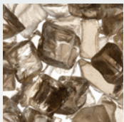
MQG5C Braise de verre décoratif