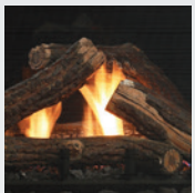
M42LOG4 Bûches de chêne