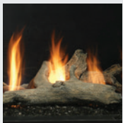
M42LOG3 Bois de grève