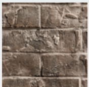
MP42RLT Doublure de brique Traditionnelle