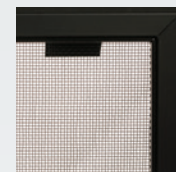
Écran de sécurité