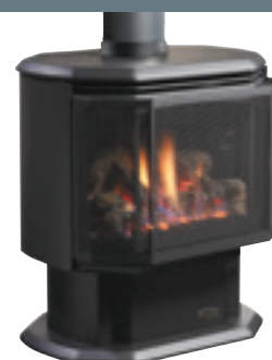
Écran de sécurité