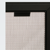
Écran de sécurité