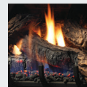
L'ensemble de bûches chêne fendu LOGF27