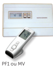
PF1 ou MV

Télécommande Marche/arrêt, thermostat marche/arrêt, thermostat marche/arrêt modulant